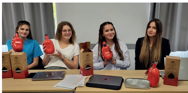
Découverte du produit et construction de l'argumentaire de vente en atelier.