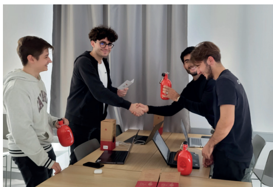
Entraînement – Simulation de vente en atelier.