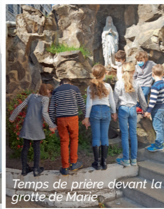
Temps de prière devant la grotte de Marie

« Seigneur, Ouvre mes oreilles et mon cœur à Ta parole. Rends-moi attentif à ceux qui m'entourent. Mets sur mes lèvres des paroles qui donnent la joie. Ouvre mes mains pour qu'elles sachent donner et recevoir. Conduis mes pas vers ceux qui sont seuls ou découragés. Fais-moi trouver des gestes de paix et d'amitié. Rends-nous forts pour travailler, aimer, pardonner. Amen »