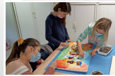
Réalisation d'une icône pour Noël