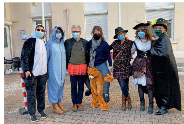
Sous les masques, l'équipe de l'école