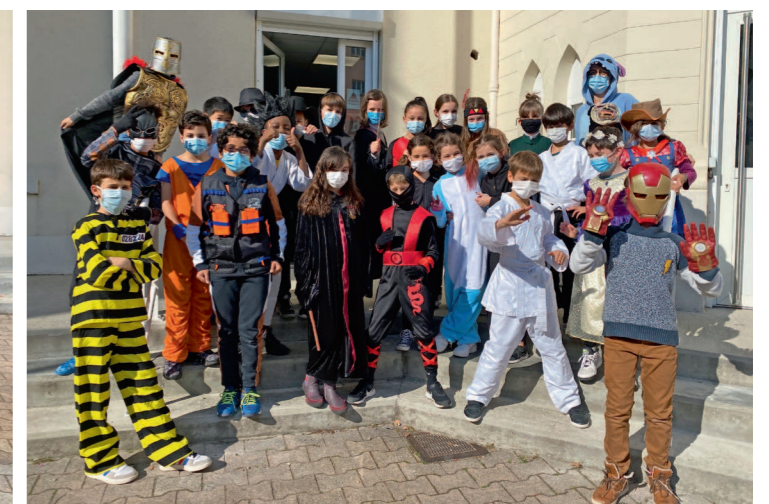
Les super-héros sont de sortie