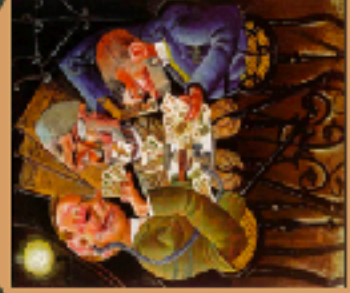
Otto Dix, Les joueurs de Skat , 1920

NOUVELLE OBJECTIVITÉ : REPRÉSENTATION DE LA VIOLENCE DE LA GUERRE ET DE LA RÉALITÉ SOCIALE ET HUMAINE