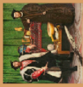
Hans Holbein, Les Ambassadeurs , 1533

USAGE DE L'ANAMORPHOSE, DISTORSION VISUELLE DU CRÂNE