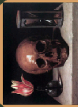
Philippe de Champaigne, Skull , 1696, tête moulée du 17e siècle, tulle sur bois, serrure. Musée de Troyes

CODIFICATION D'UN GENRE NOUVEAU AU XVIIÈME SIÈCLE : LA VANITÉ