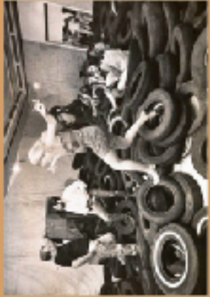
Allan Kaprow, Zero , 1967

APPARITION DES INSTALLATIONS, DES HAPPENINGS, AUTOUR DES ANNÉES 1960