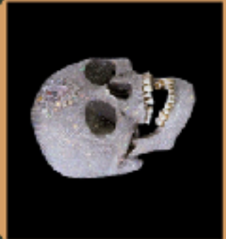
Damien Hirst, Eye of Love of God , 2017, diamants et crânes, 17,000,700,000, White Cube Collection

TRANSFORMATION CONTEMPORAINE DE LA VANITÉ, DU MEMENTO MORI PAR L'AJOUT DE DIAMANTS