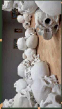
Ron Mueck, Man , 2017