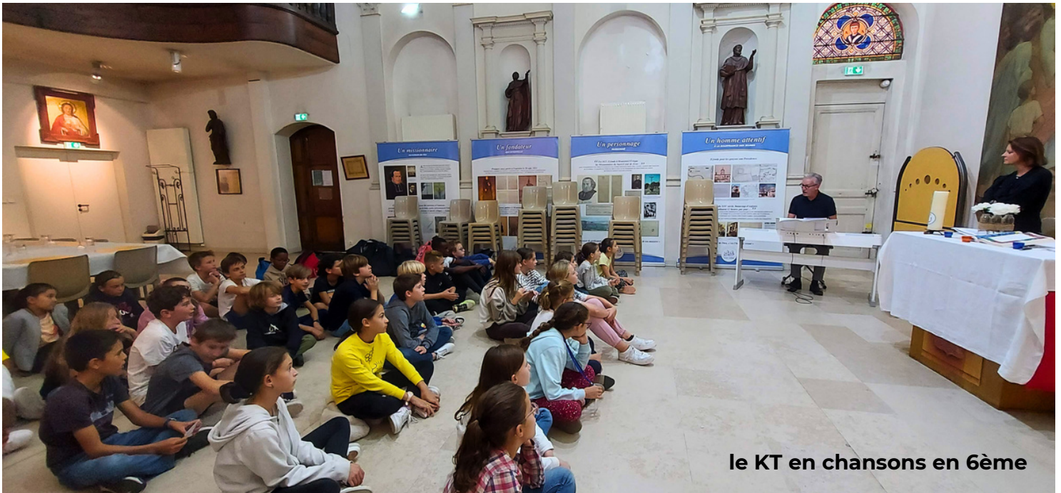
le KT en chansons en 6ème