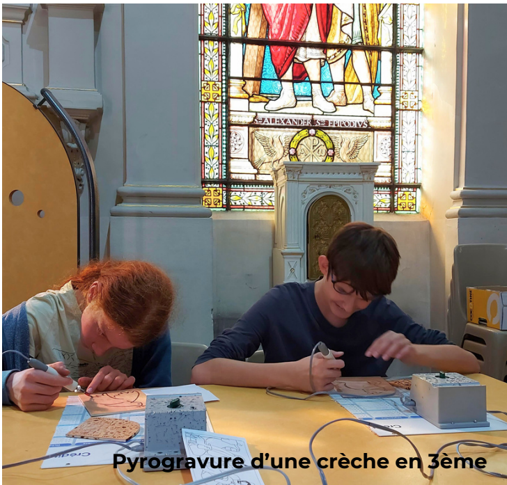
Pyrogravure d'une crèche en 3ème