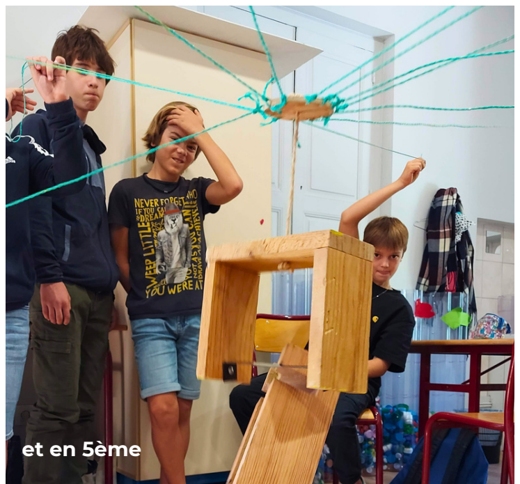
et en 5ème