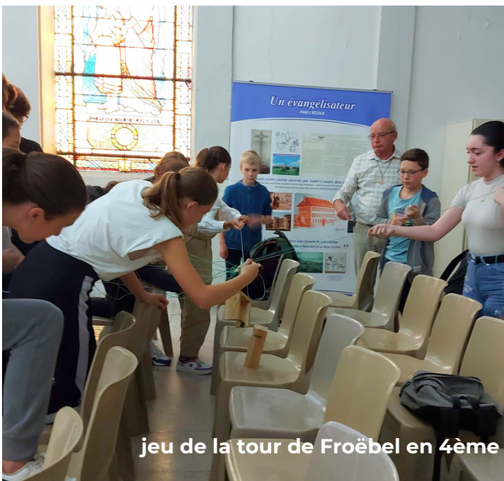
jeu de la tour de Froëbel en 4ème